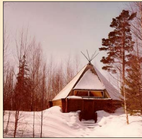
Grillkåtan i stugby Ingela.