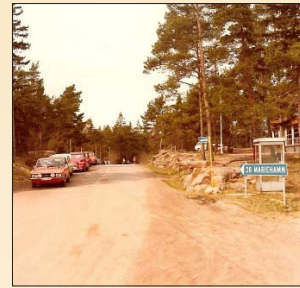
Bilkö till färjan.