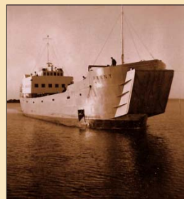
Panny på väg in till Svinö.

skärgården. M/s Panny döptes i folkmun skämtsamt om till "Suggan" på grund av sina ändhamnar. Det berättas att det gungade väldigt mycket ombord på m/s Panny, förmodligen eftersom den inte var så hög i kölen.