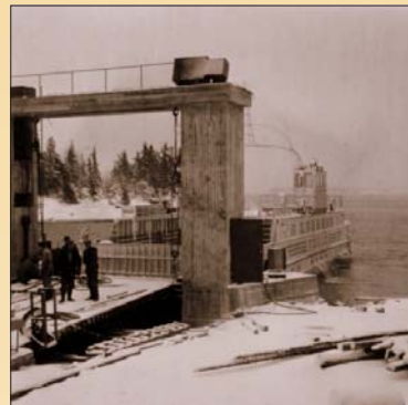
Föglöfärjan i Svinö

Transportkapaciteten var 16 småbilar. Att tiden var mogen för detta, visade sig genom att med en turtaethet om 3–4 turer dagligen, transporterade färjan 1959 ca 60.000 passagerare och 6.000 fordon. Man kan tycka att detta var en bra början, men problemfritt blev det dock inte. Det visade sig att m/s Föglös skrovform och propellersystem inte klarade den åländska skärgårdens isförhållanden. När det blev menföresperioder, avbröts Föglötrafiken. I samband med att färjfästet i Svinö blev färdigt 1957 förbättrades också trafiken till Sottunga och Kökar. M/s Kökar körde direkttrafik till Svinö tre dagar i veckan, med kombination med busstrafik mellan Svinö och Mariehamn. M/s Föglö gjorde redan 1959 två veckoturer till Sottunga och 1965 med fortsättning till Kökar. 1966 införskaffade landskapet färjan m/s Ejdern, som