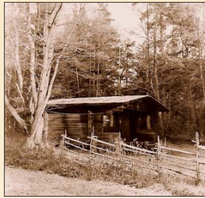
En av stugorna i stugby Ingela.