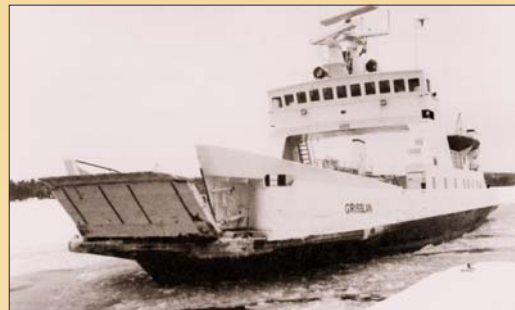
Grisslan på väg till Svinö