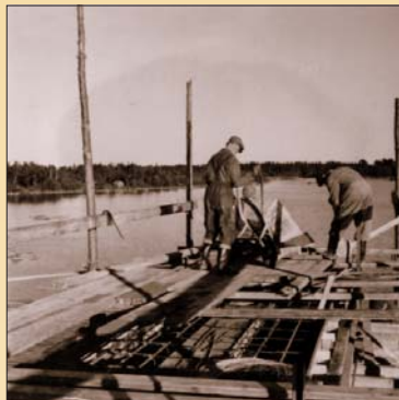
Arbete på gång