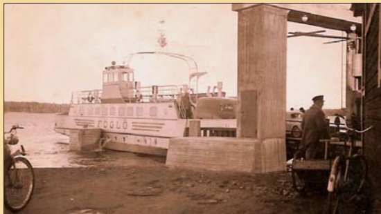
Färjhamnen i Degerby