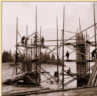
Svinö färjfäste under byggnation