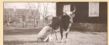
Vestergårdsvärdinna mjölkar. I bakgrunden den gamla södergårdsvärdningen.