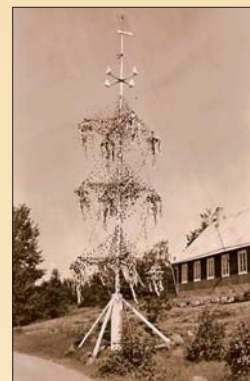
Midsommarstång vid gamla Furuborg 1950-talet

På 1920-talet byggdes ungdomslokalen Furuborg i Klemetsby till största delen med talloarbete. Denna byggnad brann dock ned under ett häftigt åskoväder 1961. Direkt efteråt byggde man den nya ungdomslokalen längre norrut, där den finns idag. Midsommarstången blev även den flyttad till den nuvarande platsen mellan Furuborg och Kapellviken. Lumparlands midsommarstång är en av de mest imponerande på Åland med sina 96 kronor i olika storlekar.