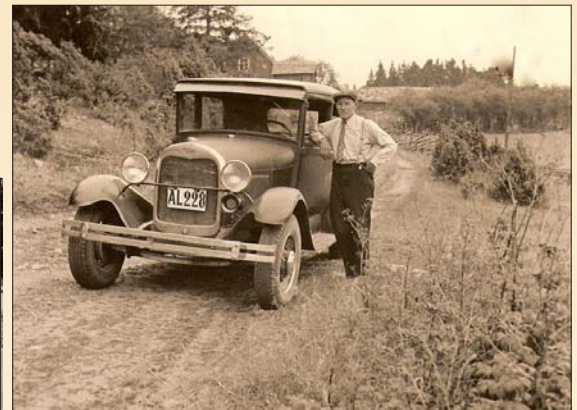
Viktor Nylund med sin taxi-bil o. bilskolebil.