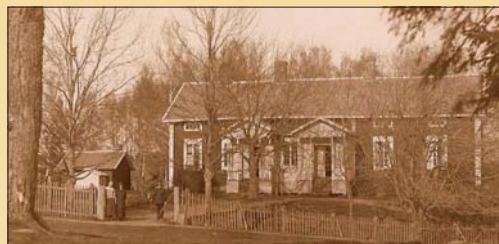
Lumparlands folkskola på 1920-talet

Kommunalt bibliotek fick Lumparland 1926. Före det fanns skolbiblioteket och det Fraserska biblioteket, efter kaplansdottern Gustava Fraser (1816–1905).