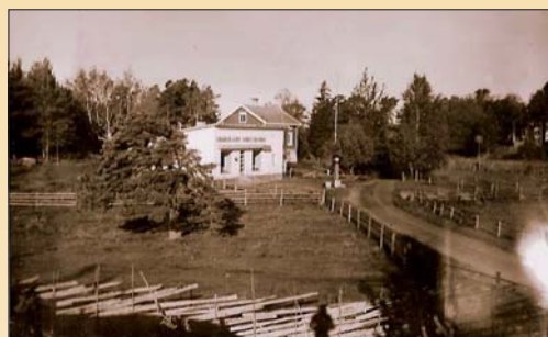
Lumparlands Andelshandel 1940-talet

År 1916 bildades åtta åländska andelslag, och ett av dem var Lumparlands Andelshandel i Klemetsby. Den första affärslokalen hyrde man vid Klockars i bagarstugan. Affärerna gick bra och redan 1922 började man planera en ny butikslokal som blev färdig året därpå. Den nuvarande butiken byggdes 1936 och har senare fått om- och tillbyggnader.