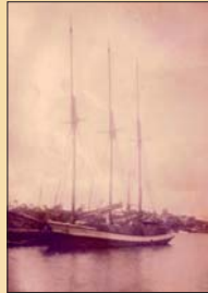
Skök Orion byggd 1919 i Norrboda

Det sista båtbygget i Norrboda var skonertskeppet Orion, som byggdes 1919 vid Strandnäs i byn och såldes redan 1920 till Sverige. Stjälproplatser har det funnits vid Västerskog och Kommanäsudden. Uppdragningsplats för båtar fanns vid Kil, Västerskog och Ängösund.