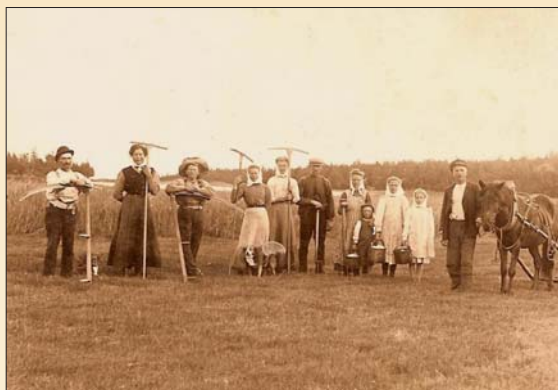
Krogstadbo på slottertalka i början av 1900-talet

Mellan Mattas och gamla mejeriet lär det ha funnits ett båtsmanstorp, från den tiden Åland och Finland hörde till Sverige. Den första officiella midsommarstången lär ha funnits i Krogstad, vid mejeriet. Här har också funnits två dansbanor, den första redan på 1920-talet. Långt inne i Långviksviken, i den gamla byn, lär det ha funnits en vattenkvarn en gång i tiden.