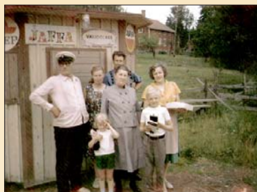
Kiosk i Krogstad 1960-talet. Bakom Södergårds manngårdsbyggnad.

bara två gårdar i byn, Södergård och Östergård. Södergård delades på 1780-talet till två gårdar, då den ena halvan blev Mattas. Det sägs att runt den gamla byn fanns det en hög gårdesgård, för att hålla rövare och även rovdjur borta från byn. Tittar man på gamla kartor är det förstärkt, eftersom byn låg nära gamla stora farleder och säkert var en skyddande vik för många sjöfarare och eventuellt också för sjörövare.