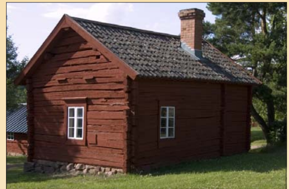
Robertas pressbod vid Jan Karlsgården, flyttad 1967 från Lumparby

I muntliga berättelser från tiden omkring Stora ofreden berättas det att en ryttare var på väg till Lumparby med bud från Haddnäs gård i Lemland. Hästen kom dock ensam till byn. Ryttaren hittades senare död på bergen mellan Skag och Lumparby. Under långa tider kallade folk därför berget till Skrinnklint/Haltberg.