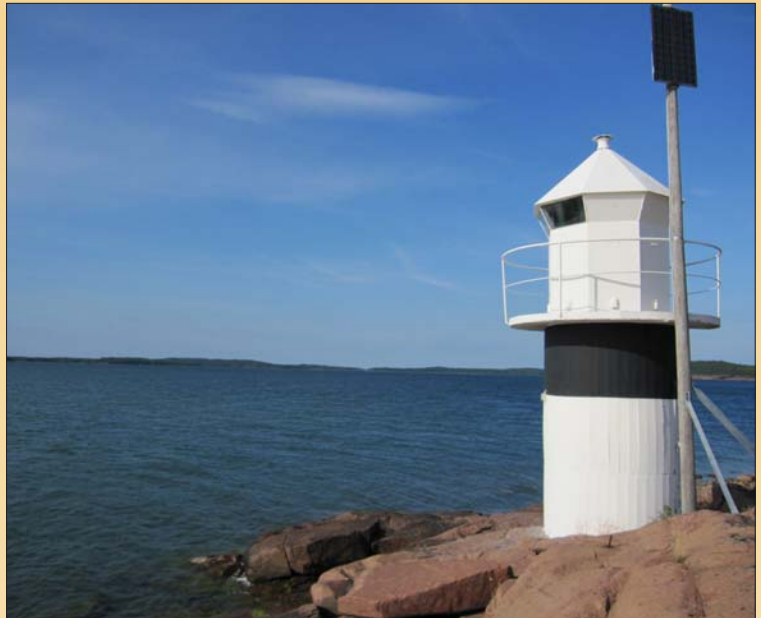
Sektorfyrv vid Lumpoppoude. Stranden mitt emot Bomarsund.