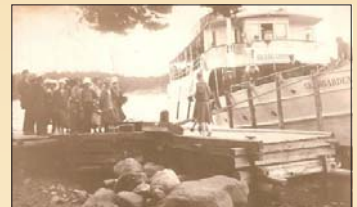
Bilden av Skärgård I. Denna bild visar hur en liten ångbåtshamn/brygga vid sekelskiftet kunde se ut t.ex. i Lumpo, när ångbåten anlöpte bryggan. (Vårdörutten: Grundsunda – (Töftö) – Vargata – Delvik – Bomarsund – (Tranvik) – Lumparby – (Granboda) – Norrvik – Mariehamn)