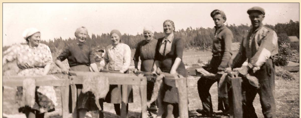
Norrbodabö och linberedning på 40-talet.