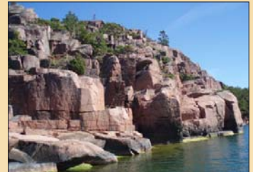
Falkberget i Lumpo. Ännu vid 1930-40 talet fanns det falkar som häckade på bergen. Kan det vara en slump att båtsmännen i Lumpo alltid hette Falk?

Ett båtsmanstorp fanns en bit söderut från denna informationstavla. Flera av båtsmännen i Lumpo hette Falk. Kanske Falkberget har inspirerat till namnet. De tre gårdarna i Lumpo, samt ett hemman från Lumparby, hade gemensamt roten. En båtsman utrustades och avlönades av en rote, vilken på fasta Åland bildades av fyra bondgårdar. Roten skulle hålla båtsmannen och dennes familj med bostad, en enkelstuga och lite odlingsmark samt lite olika förnödenheter. Det här var under tiden som Åland och Finland hörde till Sverige, före år 1809.