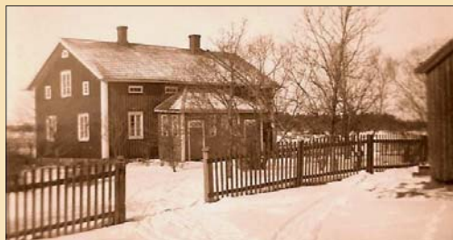
Lumparlands prästgård 1930-talet