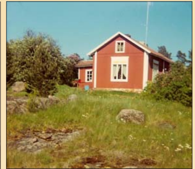
Båtsmanstorp i Svinö