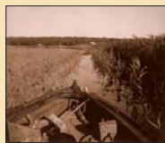
På väg till Krogstadvik

Namnet har skrivits på många olika sätt och man kan bara spekulera om namnets härkomst. Det kan betyda vikbotten eller vattenkrök, krok. Stad kan betyda båtplats. Byan namnet har också kopplats till Olavf Krog, som hade anknytning till Lemland på 1400-talet. Namnet kan även komma från ordet krog. Redan på 1500-talet bildade Lumparland ett eget länsområde och det var under den här tiden vanligen förekommande att läns-