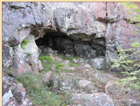
Grottan i Krogstad