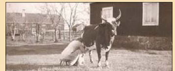
Vestergårdsvärdinna mjölkar. I bakgrunden den gamla södergårdsväggningen.