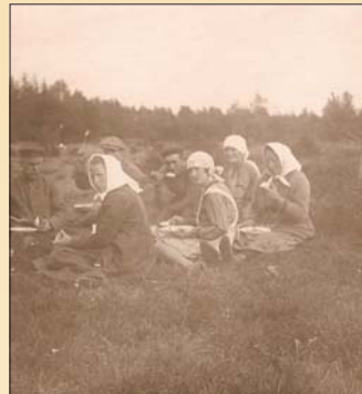
Paus på arbete 1920-talet