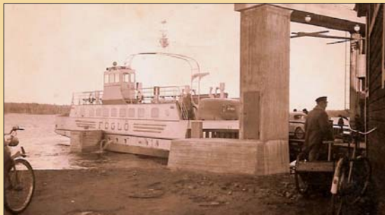
Färjhamnen i Degerby