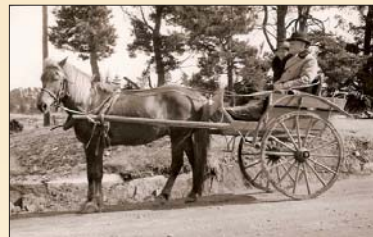
Hjalmar Jansén med dottern på Lumpovägen

Om somrarna under 1920- och 1930-talet vistades den kände finlandssvenske diktaren Elmer Diktonius (1896–1961) i Lumparland och bodde då bl. a. i Lumpo vid Södergård.