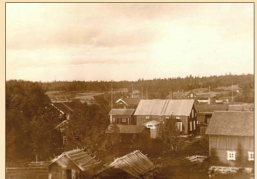
Norrboda by i början av 1900-talet. Längst fram Vestergård, Pellas till höger, bakom först Mattas sedan Mickels och vid skogskanten Östergård.