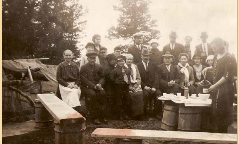
Svinö på kaffebjudning 1920-talet. Alla i byn var bjudna av en fiskarfamilj från Houtskär, Västerfjärden i bakgrunden.