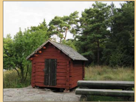
Den enda av sex strandbodas som är kvar vid Skepphus är Östergårds

Byn Norrboda existerade redan i slutet av 1200-talet, troligen redan ännu tidigare. Norrboda bestod av fem gårdar på 1500-talet, alla skattehemman, vilket betyder att bönderna ägde sin gård och betalade skatt till kronan (staten). I slutet av 1500-talet blev en gård öde och delades på 1600-talet av de övriga bönderna. Vid skattläggning 1661 bestod Norrboda av fyra gårdar; Pellas, Mickels, Mattas och Vestergård. Senare har gårdarna igen delats till olika mindre enheter.