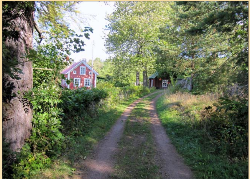
Björkvalls, bageri och butik

Mangårdsbyggnaden på Pellas och bagarstugan vid Vestergård är båda från slutet av 1700-talet. I byn har det funnits tolv väderkvarnar och nio rior samt ett tiotal smedjor. I början av 1900-talet fanns det en såganläggning vid Skepphus, vilken drevs av en lokomobil. Hos Björkvalls fanns det butik och bageri, där man bl. a. tillverkade "vridna lumparlänningar", pepparmintskarameller. Butiken hade filial i Krogstad, Lumpo, Lumparby i Lumparland samt i Söderby i Lemland. Varorna till butiken kom med Ålandsbåten till Skepphus. Efter att Lumparlands Andelshandel hade grundats 1916, förbättrades vägen till Ängösundsbron för att andelshandeln den vägen skulle få sina varor. På 1950-talet inleddes mjölkbåtstransporten från skärgården till samma brygga. På 1800-talet fanns det ett tegelbruk vid Ängösund, där det slogs tegel till byggandet av Bomarsunds fästning.