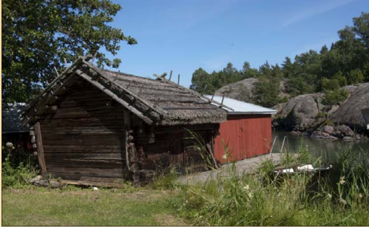
En gammal bod vid byhamnen

Svinö har antagligen fått sitt namn efter att man helt enkelt släppte ut svin på bete på ön. I skrift nämns byn på 1400-talet, men förmodligen är byn befolkad redan på 1100–1200-talen, liksom de andra byarna i Lumparland.