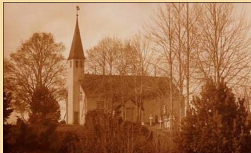
Lumparlands kyrka på 1926.

Namnet Klemetsby kan ha koppling redan till medeltiden. Klemet är ett mansnamn och by betyder nybygge. När Klemetsby nämns för första gången i skrift är det i skatteboken från 1537 och som "Clemetszby". Själva byn har nog funnits långt före det, eftersom det redan då fanns fyra gårdar i byn. Böle, i dagligt tal kallat Börs, som var skattehemmanet och de tre andra var kronohemman.