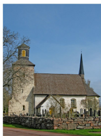
Kyrkogårdsfonden vid Lemlands kyrka

Sjärlaringning till minne om den avlidne ordnas dagen efter dödsfallet eller enligt avtal.