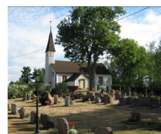
Blomsterfonden vid Lumparlands kyrka