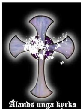
Ålands unga kyrka

Är du konfirmerad? Välkommen med i Hjälpledarskolningen som blir 9-11.10 i Jomala församlingshem